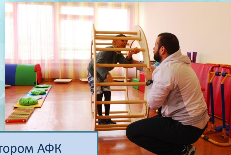
Занятия с инструктором АФК