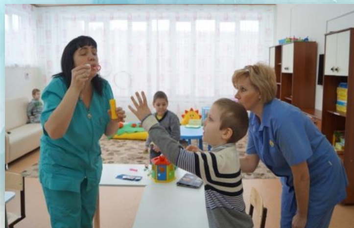
Работа воспитателя в группе