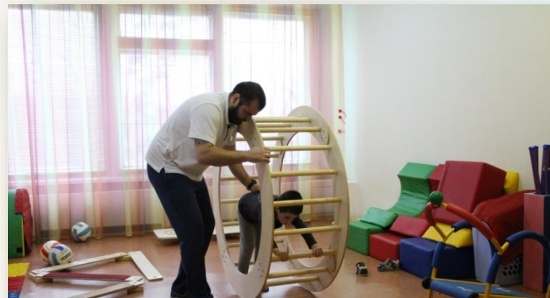
Занятие с инструктором АФК