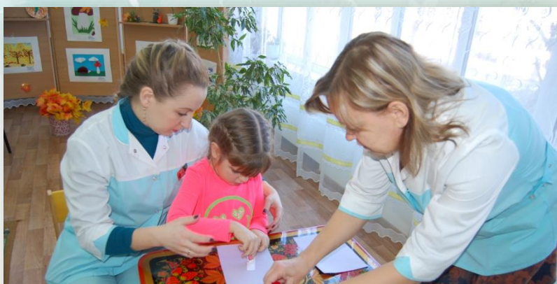
Занятие с педагогом по изодейтельности