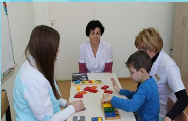
Занятие с дефектологом