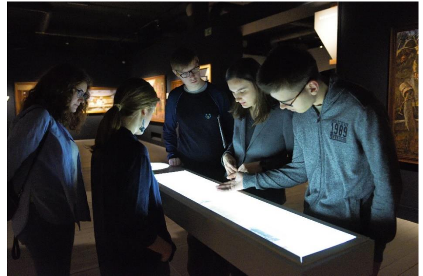
Институт русского реалистического искусства, 2017