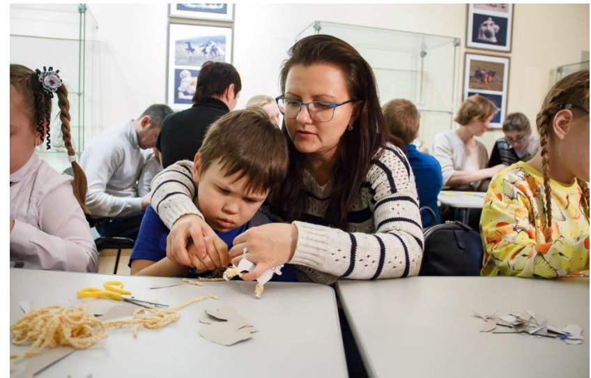
Кемеровский областной музей изобразительных искусств, 2017